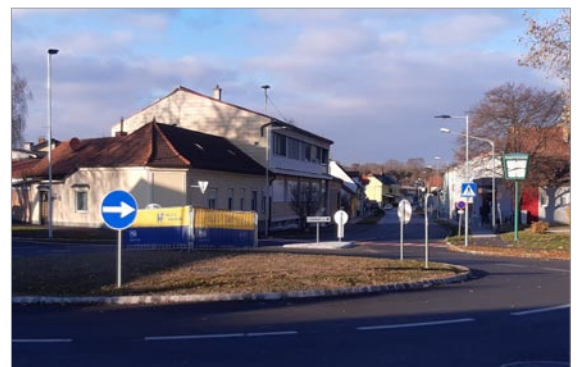
Neuer Kreisverkehr, rechtzeitig vor Schulbeginn fertig gestellt

Im Zuge dessen sind neben den Hausanschlussleitungen auch die Telefonleitungen in die Erde verlegt worden. Die Wasserleitung inkl. neuer Hausanschlüsse und die Lichtpunkte wurden bei dieser Gelegenheit ebenfalls erneuert.