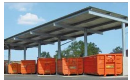
Beispiel eines modernen Wertstoff-Sammel-Zentrums

Die genauen täglichen Öffnungszeiten sind leider noch nicht bekannt, der Grünschnittbereich soll allerdings täglich 24 Stunden geöffnet sein.