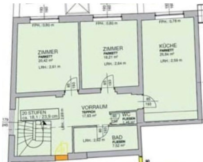
Wohnung im 2.Stock des Gemeindeamtes

D ie durch den Umbau geschaffene Wohnung im zweiten Stock ist bezugsfähig und steht zur Vermietung frei. Die Kosten für die 91 m 2 große Wohnung belaufen sich auf 775,- Euro/Monat inkl. Wasser und Heizung.