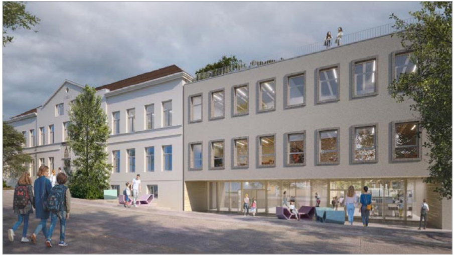
Ansicht des neuen Eingangsbereichs ins Schulgebäude.

Die grundsätzlich schon im Rahmen des Projekts empfohlene und seit dem Beginn der Planungsarbeiten diskutierte Zusammenführung der beiden bestehenden fossilen Heizsysteme , sowie der damit verbundene Umstieg auf ein gemeinsames nicht fossiles Heizsystem musste überdacht und letztlich verschoben werden. Aufgrund der zu erwartenden hohen Projektkosten wurde im Gemeinderat am 22.09.2021 entschieden, die Heizungsumstellung (ca. 360.000,- Euro) auf einen späteren Zeitpunkt zu verschieben.