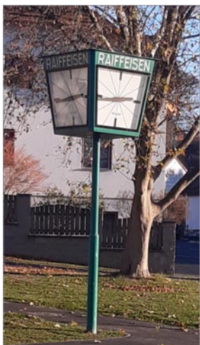
Die Uhr, restauriert am neuen Platz

Standort für solch einen Großbaum nicht geeignet. Wir hätten lieber, wie sicher auch viele Auersthale- rinnen und Auerthaler, unser Wahrzeichen „Die Uhr“ auf diesem Platz gesehen.