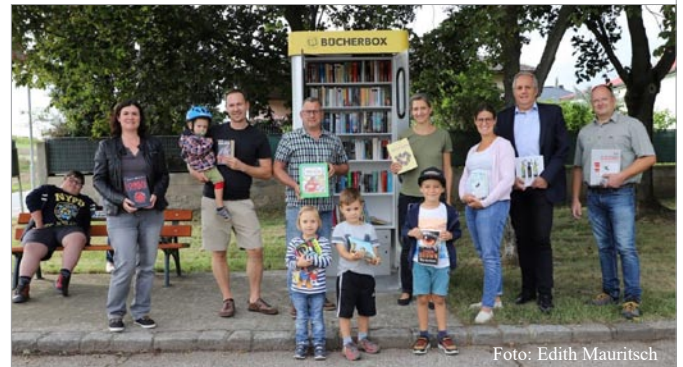
Das Team der BÜCHERBOX wünscht viel Spaß beim Lesen.