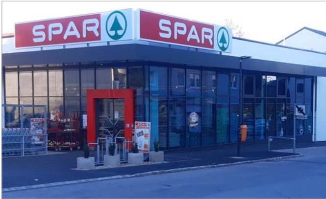
die neue eröffnete SPAR Filiale

Am 28.10.2021 wurde nach kurzer Bauzeit die neue und vergrößerte SPAR Filiale im Ortszentrum eröffnet.